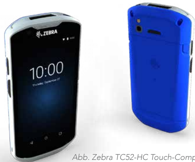
Abb. Zebra TC52-HC Touch-Computer

Überzeugen Sie sich selbst und fordern Sie noch heute ein auf Ihr Haus abgestimmtes Angebot an. Wir setzen uns flexibel und intensiv mit Ihren individuellen Anforderungen auseinander und finden für Sie die passende Lösung.