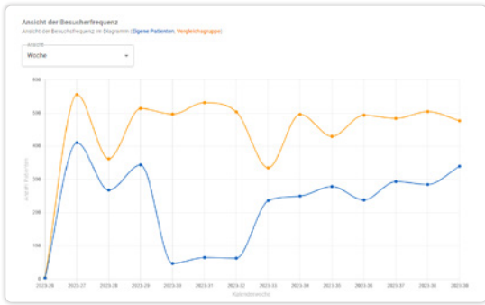
Wochenansicht der Besucherfrequenz in der Praxis.