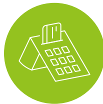
1 x E-Health- Kartenterminal