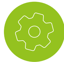
Anfahrt, Installation und Kurzeinweisung

im Wert von 3.201,68 Euro netto zzgl. MwSt.