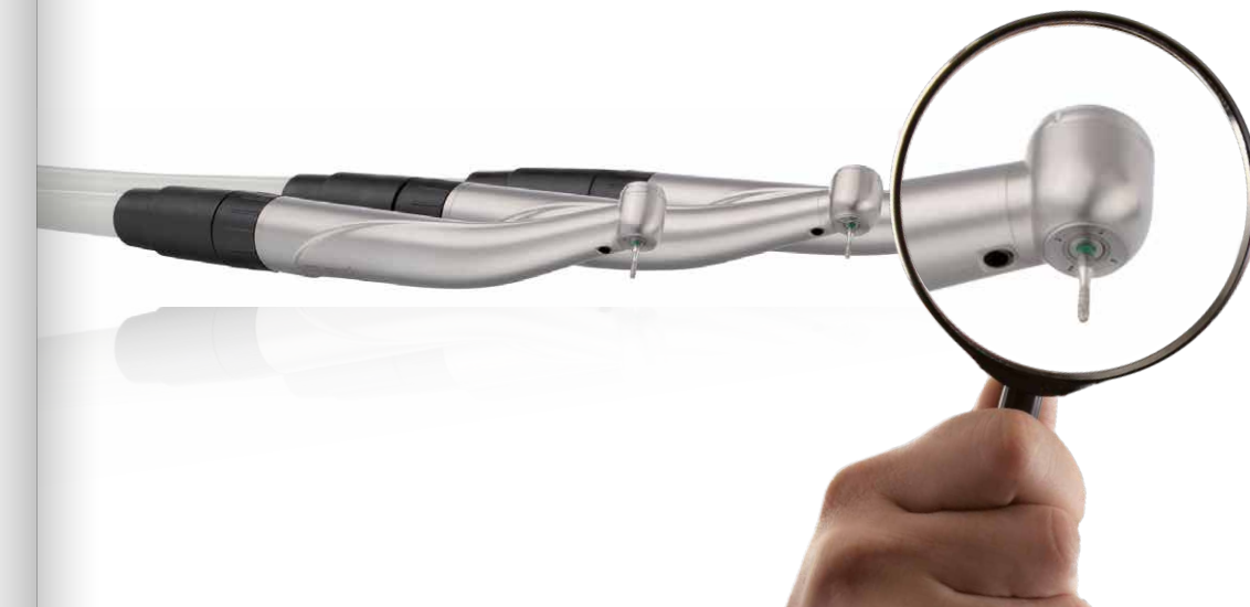
Spitze in Dokumentation und Sicherheit: die Material- und Hygieneverwaltung.

de sowie Anbruchs- und Verfallsdaten werden permanent überwacht und helfen Ihnen so Kosten einzusparen. Die Ist- und Sollbestände werden ausgewertet und Bestelllisten bzw. Fehlmengen je Zimmer automatisch vorgeschlagen. Auch hier ist der lückenlose Nachweis des verwendeten Materials mit Chargennummer beim Patienten jederzeit gegeben.