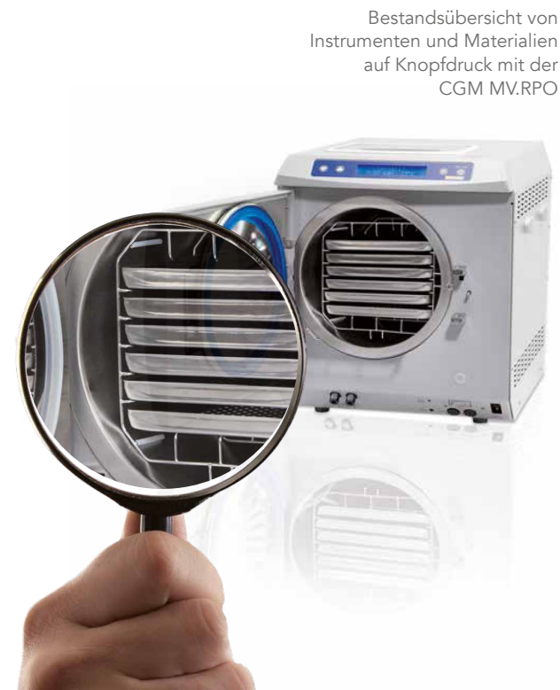
Bestandsübersicht von Instrumenten und Materialien auf Knopfdruck mit der CGM MV.RPO

Der Sterilisationsvorgang wird von dem zuständigen Mitarbeiter beurteilt. Zum Sterilisationsprozess wird das Protokoll mit Charge, Prozess-ID, Belader- und Freigeber mit Mitarbeiteridentifikation lückenlos archiviert. Bei z. B. einer Praxisbegehung stehen auf Knopfdruck alle Dokumentationen zur Verfügung.